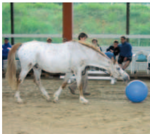
Kunststücke wie Ballspielen oder Teppichrollen können von Pferd und Hund gleichermaßen oder auch nacheinander und in kleinen Variationen ausgeführt werden: Der Araber-Appaloosa Smartie rollt den Ball mit der Nase, Baileys kombiniert die Übung zusätzlich mit dem Spanischen Schritt.