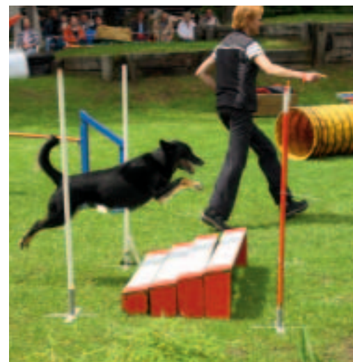
Der Schäferhund Jonas lässt sich über den Weitsprung schicken. Manche Hunde sind sehr schnell, so dass vom Menschen nicht nur Sportlichkeit gefragt ist, sondern auch eine besondere Reaktionsgeschwindigkeit.

meinsam, ohne Leine und Körperkontakt einen vielfältigen Hindernisparcours bewältigen.